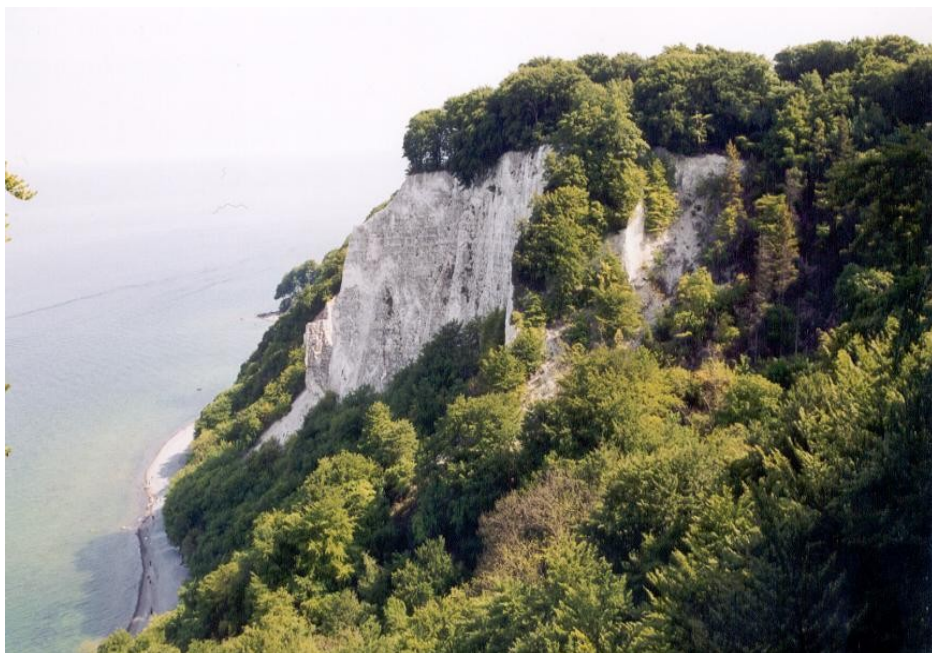
Udsigten fra Königsstuhl i Jasmund Nationalpark, Rügen