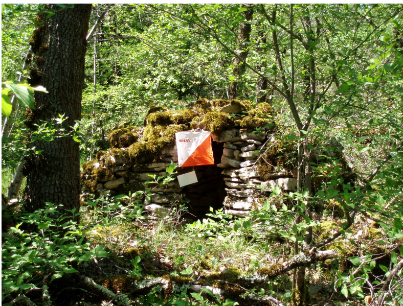
Idyllisk fransk postplacering ved ruin af fårehyrdehytte