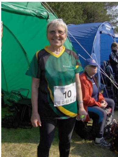
Formanden til påskeløb

Ved den første match ved Slagelse i marts var vi 38 tilmeldte, og alle baner var fuldt besat. Ved det sidste løb i Stenholt Vang var vi i alt 39 tilmeldte, og også denne gang var alle baner fuldt besatte. Det var endda sådan, at der på enkelte damebaner var et lille overskud. Jeg kan ikke erindre, at det er sket før! Når dækningen ser sådan ud, er der plads til lidt fejlklip, og at enkelte ikke gennemfører, men der skal ikke være for mange af den slags!