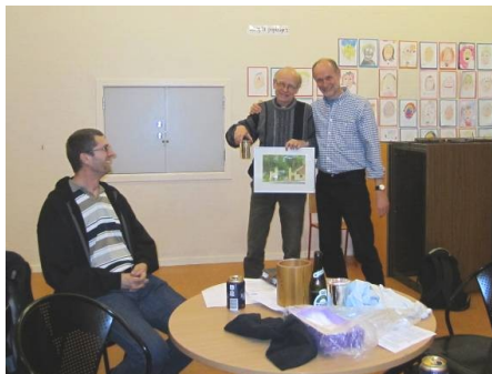
”Se min flotte pokal og billede”