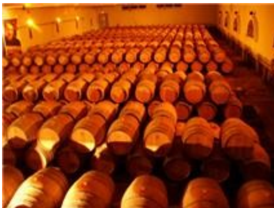
Vinkælder på et vin co-operativ i Buzet i Sydvestfrankrig

29. oktober: Franske sprintmesterskaber i Provence + andre løb.