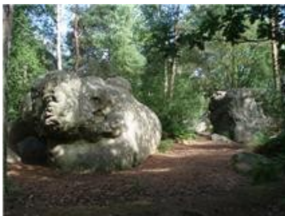
O-område ved Fontainebleau, syd for Paris

Club NORD, Nerac, Lot et Garonne / i DK tidl. Ølgod / OK West / O-63, Vordingborg