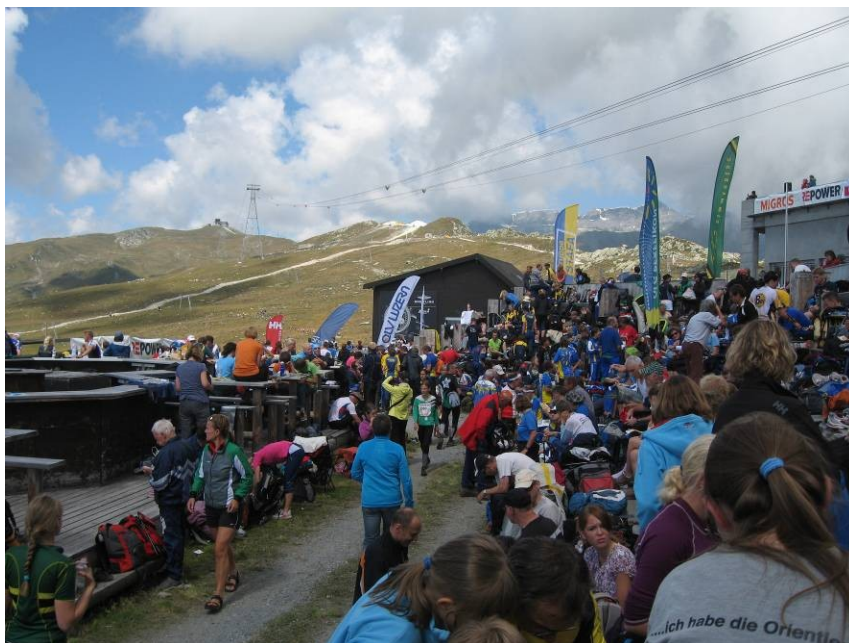
Stævnepladsen ved 2. etape