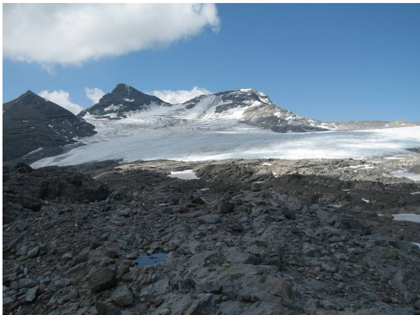
Løbsområdet ved 3. etape

3. etape havde vi begge set meget frem til. Løbsområdet var beliggende nedenfor Vorab Gletscheren i ca. 2600 m. højde. Løbsområdet var fyldt med sten og klipper, så der var virkelig tale om o-løb on the rocks! Løbsområdet var for blot få år siden en del af Vorab Gletscheren, men pga. afsmeltning, er området i dag isfrit om sommeren. Heldigvis var vejret rigtig godt, da der ellers var stor risiko for at etappen måtte aflyses i dårligt vejr. Blot 14 dage tidligere havde der været snestorm i løbsområdet.