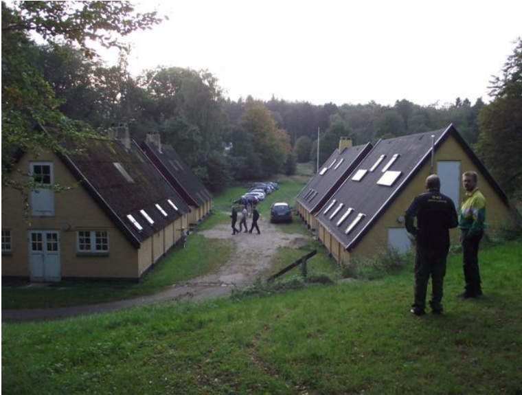
Udsigten ned gennem lejren