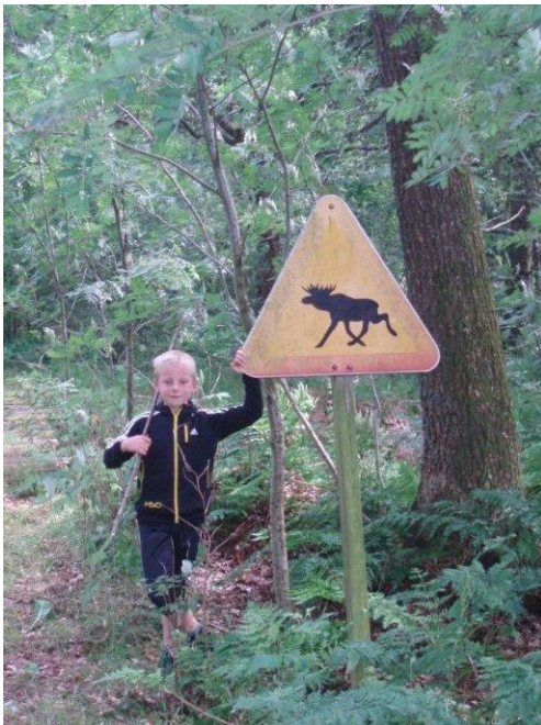
Pas på Elge

Begge opgaver skal løses for at kunne deltage i konkurrencen. Der vil være en god flaske rødvin til vinderen, som vil blive afsløret formentlig ved klubaftenen d. 17. maj.