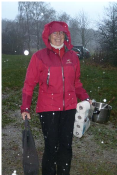
Når nøden er størst .....