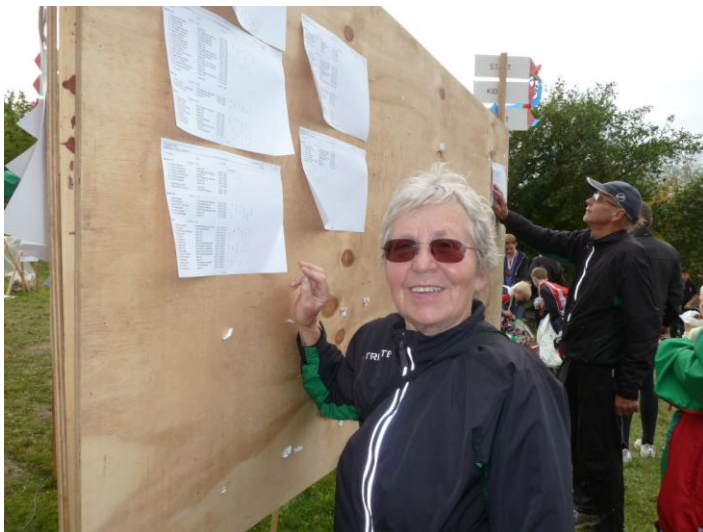
En meget glad holdsætter konstaterer, at sejren er hjemme