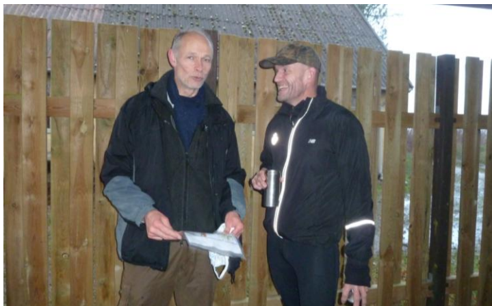
Så er enhederne sat på!

Kong Vinter havde dækket det meste af Sjælland med et pænt lag sne, som påvirkede trafikken. På Falster fik vi kun lidt slud. Sneen på Sjælland har nok været medvirkende til, at antallet af deltagere var lidt mindre end estimeret. Men vi var meget glade for at se de 72, som mødte op.