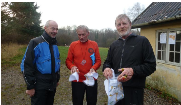
Banelæggeren med to våde O-63'ere

Løberne gav udtryk for, at skoven var meget våd og tung at løbe i, men der var mange rosende ord til banelæggeren for de udfordrende baner, det var lykkedes ham at lave.