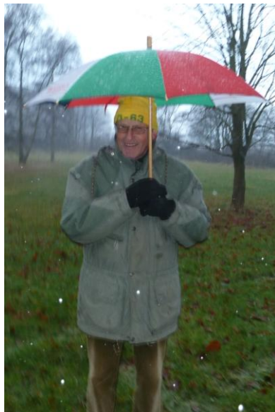
Parkeringsvagt med læskærm

Klubben havde lejet Amagerhuset, som var en god base for stævnet. Vi havde dog den tvivlsomme fornøjelse at dele huset med indtil flere mus, som ikke generede sig for at løbe langs panelerne trods vores aktiviteter. De var så frække at gå i vores tasker efter madpakker og hjemmebag.